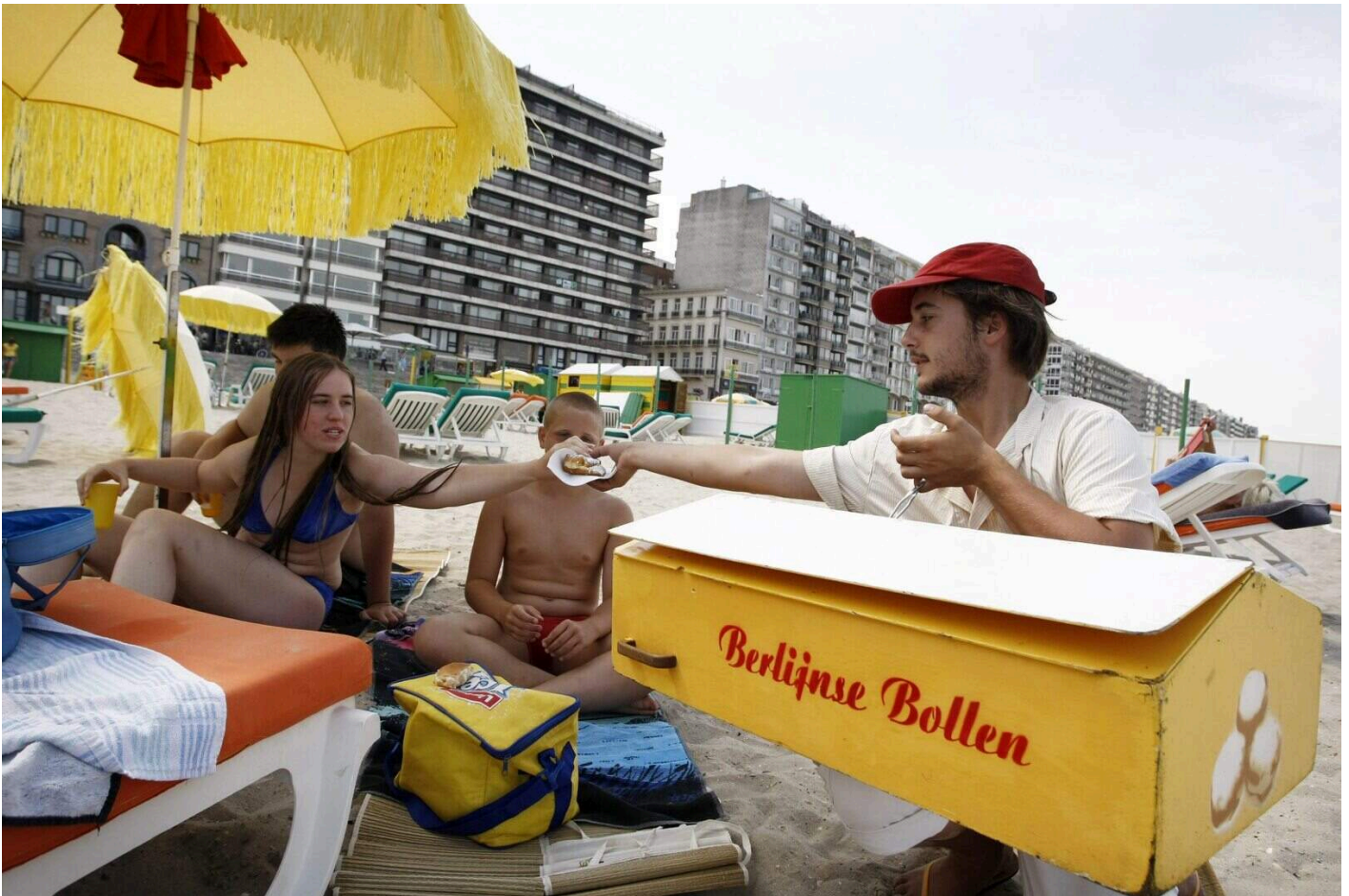
Een student verkoopt Berlijnse Bollen op het strand van Blankenberge.